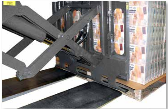
Dispositivo Push - Pull